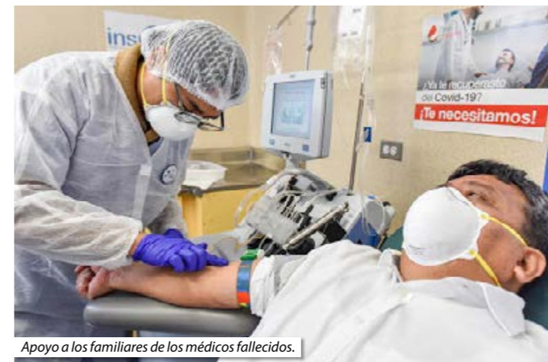
Apoyo a los familiares de los médicos fallecidos.

De este modo, el Notariado vigoriza la línea de Proyección Social, Responsabilidad Social y empatía con la comunidad, que siempre lo ha caracterizado.