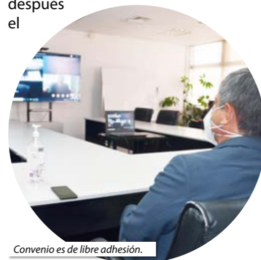
Convenio es de libre adhesión.

Las solicitudes para constituir empresas MYPE serán tramitadas a través de los Centros de Desarrollo Empresarial (CDE)-PRODUCE, para que después el