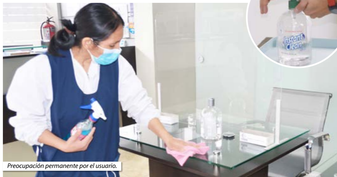
Preocupación permanente por el usuario.

Así, explicó, que las personas deben ponerse en contacto con cada notaría. Agregó que las direcciones de las oficinas notariales, teléfonos, correos electrónicos, páginas web, se encuentran en las páginas web de cada uno de los Colegios de Notarios.