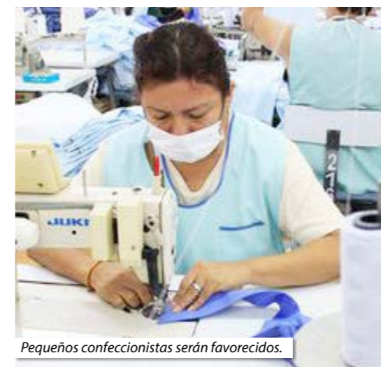
Pequeños confeccionistas serán favorecidos.

Notario otorgue la escritura pública de constitución, con intervención de los otorgantes y cumpliendo con las normas de prevención del lavado de activos y del financiamiento del terrorismo. Precisa el Pacto Interinstitucional que las solicitudes de constitución serán enviadas a través del Sistema de