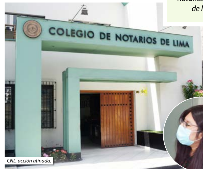
CNL, acción atinada.

Ese mismo día, la Junta Directiva del Colegio de Notarios de Lima (CNL), en sesión no presencial, emitió un pronunciamiento por el cual, dando muestras de actitud responsable, y en consonancia con la disposición legal, disponía el cierre de los oficios notariales, del 16 de marzo al 30 de marzo del presente, “a fin de priorizarse la salud y protección sanitaria de quienes pudiesen recurrir en solicitud del ser-