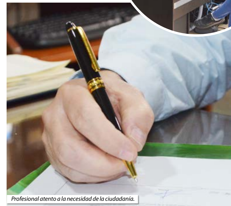
Profesional atento a la necesidad de la ciudadanía.