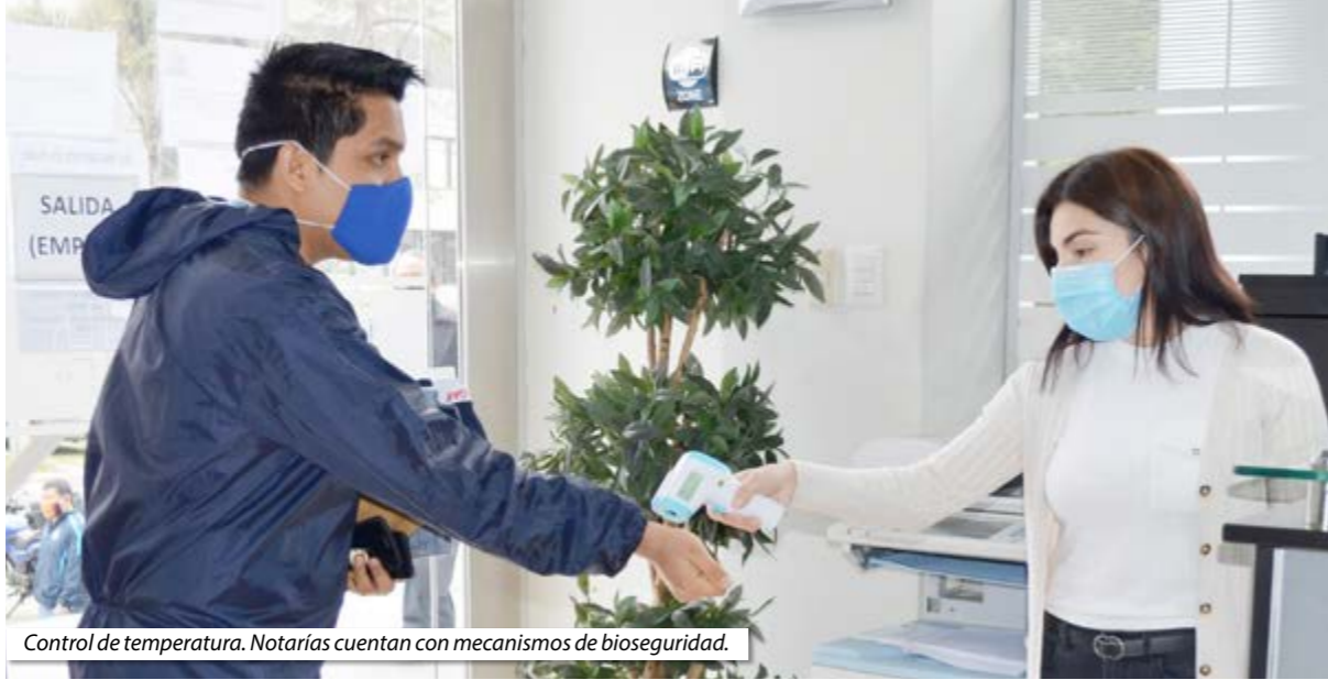
Control de temperatura. Notarías cuentan con mecanismos de bioseguridad.