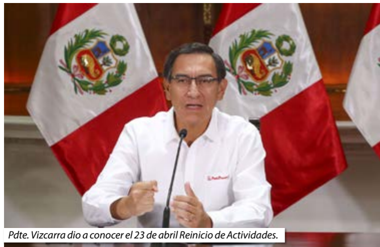
Pdte. Vizcarra dio a conocer el 23 de abril Reinicio de Actividades.

Apenas inició la crisis, el CNL sostuvo que el Notario ejerce una Labor Esencial para el país. Por ello, el Estado dispuso que este profesional reactive funciones en mayo