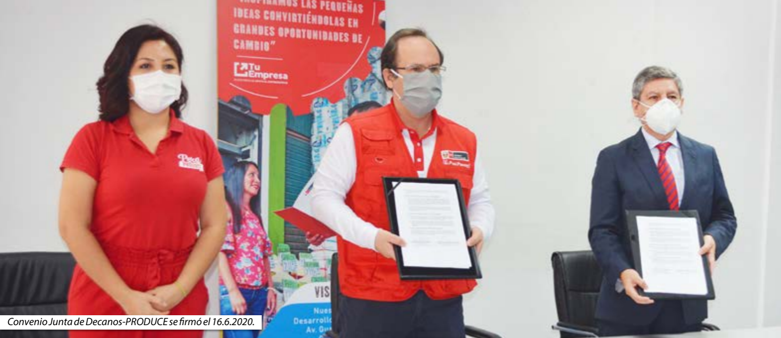
Convenio Junta de Decanos-PRODUCE se firmó el 16.6.2020.