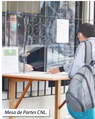
Mesa de Partes CNL.

Esta entidad tiene un riguroso control en las medidas de bioseguridad requeridas por el Estado, tales como: control de temperatura, desin-