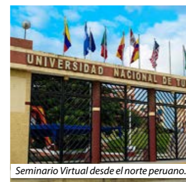
Seminario Virtual desde el norte peruano.

El Decano del CNL fue el 1er. Expositor del Seminario Virtual Gratuito El Rol de la Función Notarial y el Sistema Registral, organizado por la Universidad Nacional de Tumbes-Facultad de Derecho y Ciencia Política y realizado el 7 y 8 de agosto del presente. Durante su ponencia, “La función notarial ante los retos de las nuevas tendencias y los medios tecnológicos”, señaló que las tecnologías no son ajenas a la función notarial, pero hay que “privi-