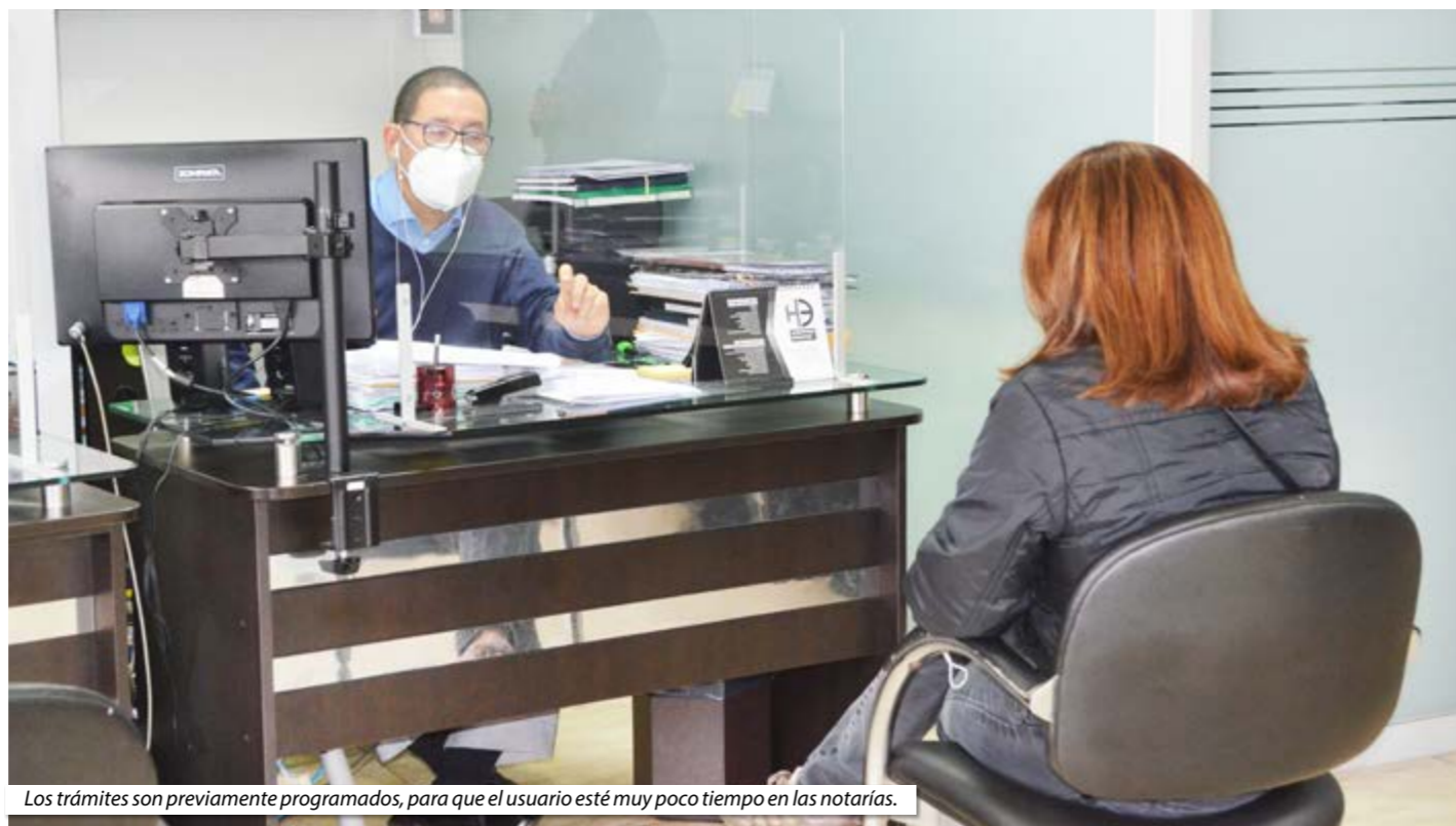
Los trámites son previamente programados, para que el usuario esté muy poco tiempo en las notarías.