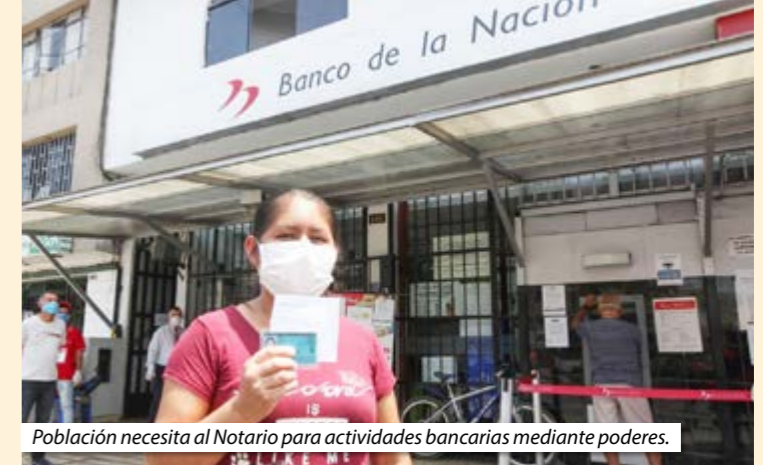
Población necesita al Notario para actividades bancarias mediante poderes.