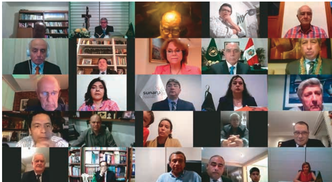
❖ UINL y CNL, unidos.

Estas apreciaciones fueron dadas a conocer