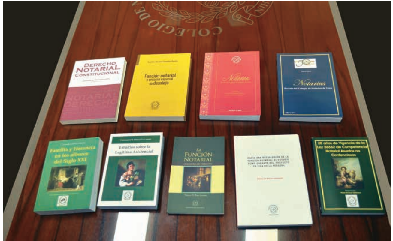
❖ Once títulos a disposición de la comunidad académica.