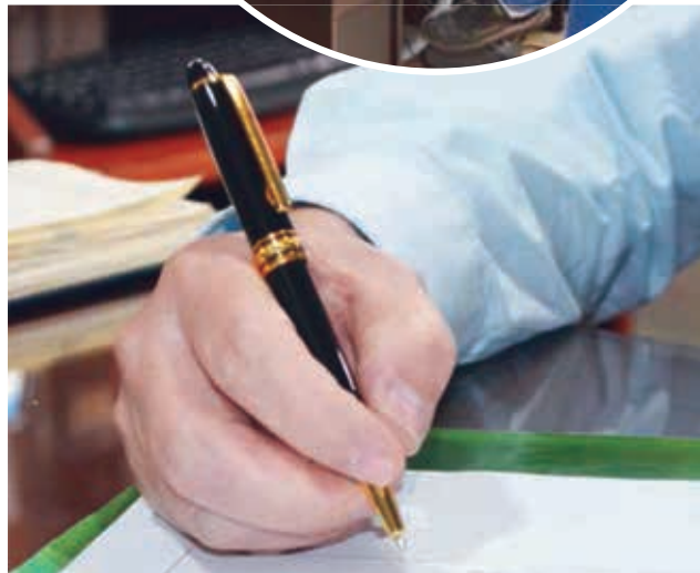
❖ Profesional atento a la necesidad de la ciudadanía.

impone a consideración del no del Colegio el Proyecto e en su de Reglamento propon- del Decreto Legisla- normas. tivo 1049, para que almente, sea de conocimiento, posteriormente, del