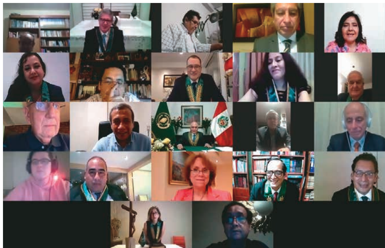
❖ Juramentación Virtual del Tribunal de Honor, 15.1.2021.