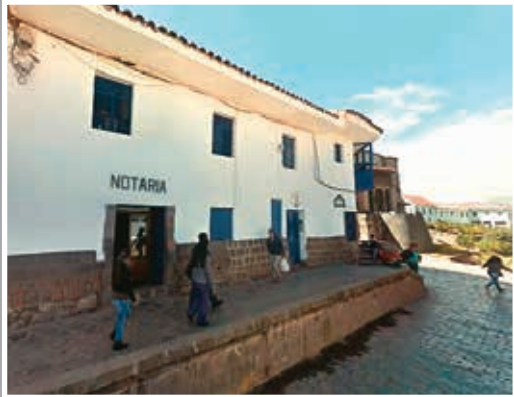
❖ Notarios del interior del país. los más afectados por pandemia.