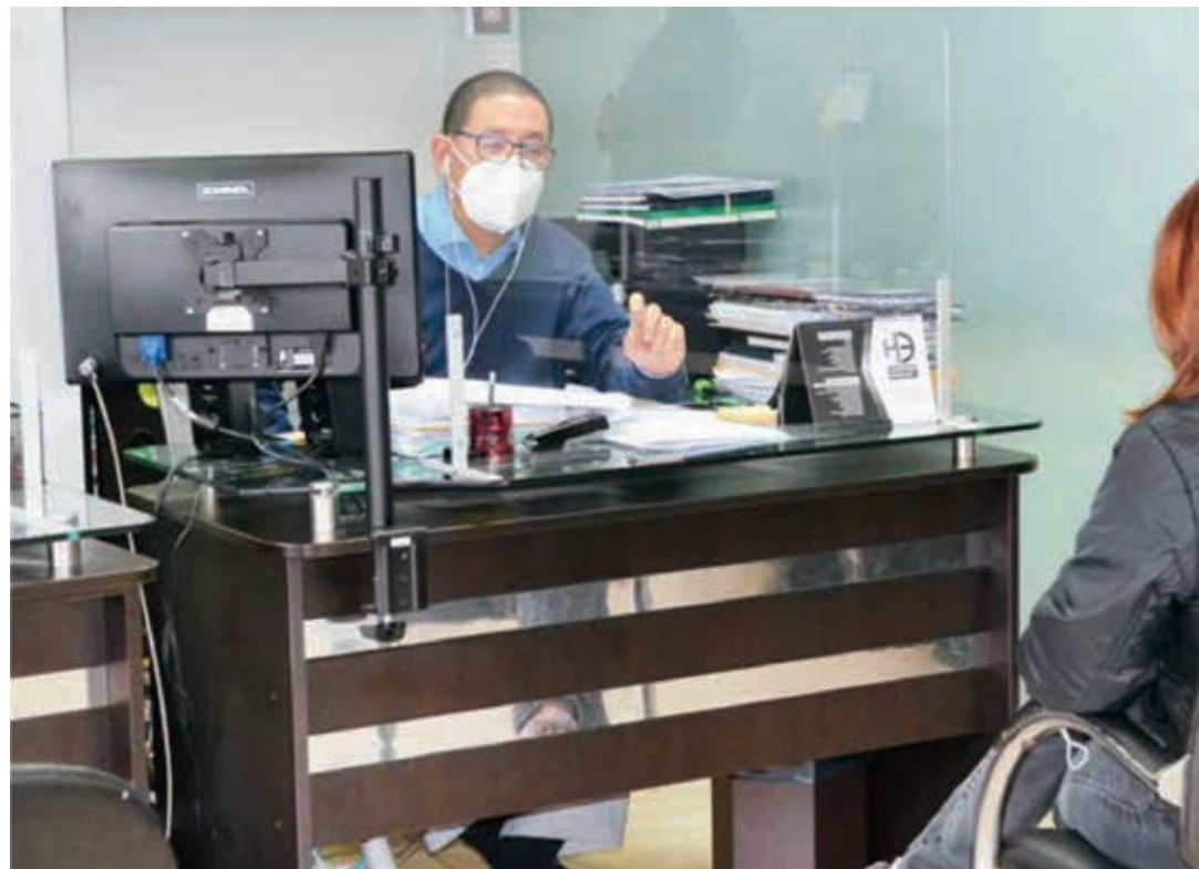
❖ Preocupación permanente por la población.