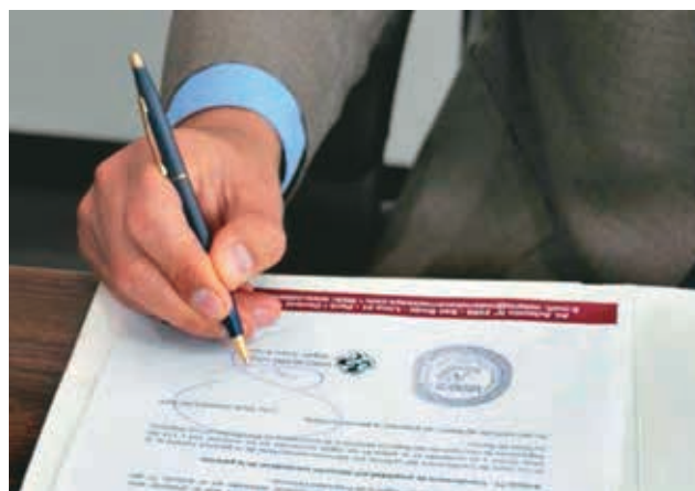
❖ Actuación notarial, garantía de seguridad jurídica.

des son encabezadas por el Decano de la Orden y se realizan en el marco de las acciones de Res-