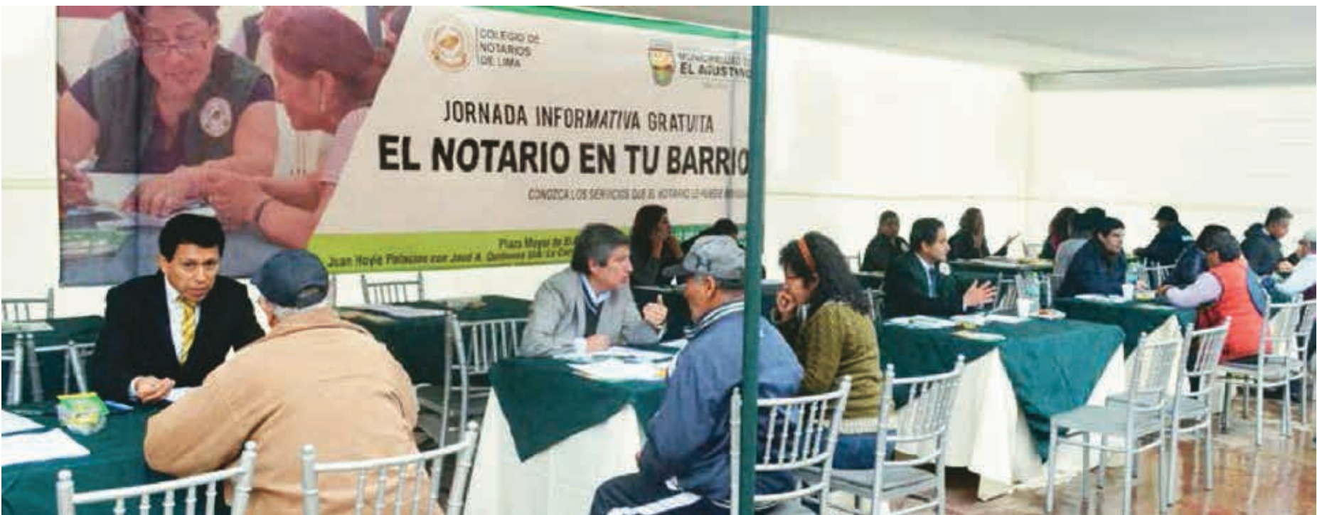
❖ El Notario en tu Barrio en El Agustino, 17.8.2019.