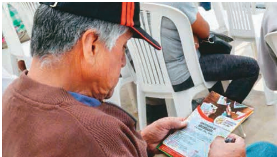
❖ El público, el gran beneficiado. Lurigancho-Chosica, 7.12.2019.

El éxito de las jornadas notariales del CNL muestra el interés creciente de la población por conocer las actividades que se pueden efectuar en las notarías y reafirma la preocupación constante del Nota-