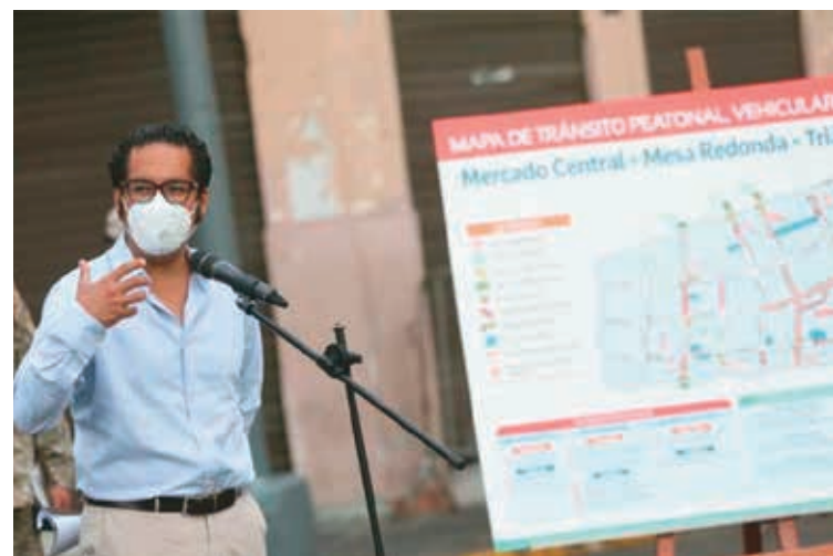
❖ Ministro de la Producción José Chicoma.

Al respecto, la Oficina de Prensa de PRODUCE informó que “en los próximos días se lanzará la plataforma digital Crea Tu Empresa, que permitirá a los emprendedores constituir su empresa de manera ágil, en el lapso de 1 semana, desde la seguridad de su casa y sin exponerse a contagios”.