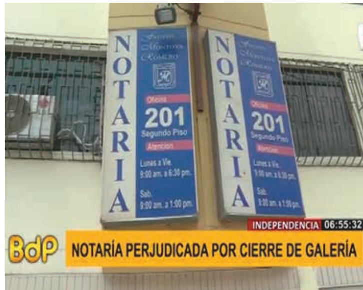
❖ El Notariado demostró que, pese a las contingencias, está al servicio de la ciudadanía.