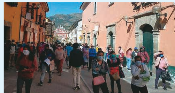
❖ Pobladores ayacuchanos, beneficiados.