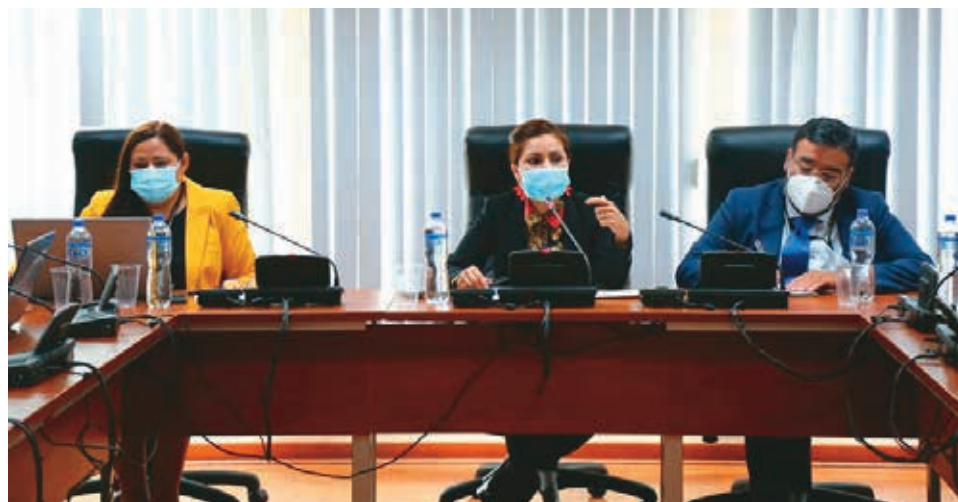
❖ Cong. Leslye Lazo, Pdta. de la Comisión de Justicia y DD. HH.

El Decano del CNL brindó opinión respecto de la determinación del número de plazas en el