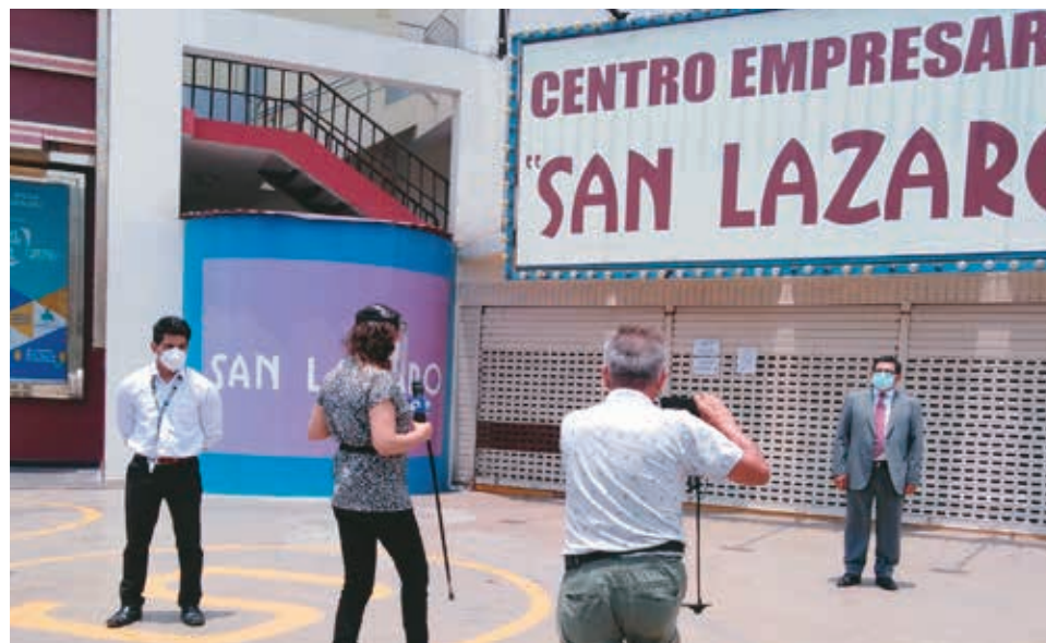
❖ Los medios de comunicación estuvieron atentos.

La gestión realizada por el Colegio de Notarios de Lima resultó exitosa. Se impuso la ley, tanto más si se toma en cuenta que la última parte del Art. 1 del Decreto Legislativo 1049, Ley del Notariado, dispone que "Las autoridades deberán prestar las facilidades y garantías para el cumplimiento de la función notarial".